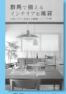
発行:シンクリード 税込 880円

この4月に引越して1ヶ月程経つと、改めて必要な物や家具に気づいたり、部屋をこんな風にしたという具体的な案が浮かぶ人も多いのでは。近頃はイケアなど安くおしゃれな大型家具店もあって県外へ目を向けがちですが、県内だって負けてはいません。北欧ヴィンテージ家具からオーダー家具、なんと新品家具のレンタルサービスまであります。ドライブにより気候のこの頃にこの本を参考に気になるインテリアショップ巡りもよいのではないのでしょうか。雑貨店もたくさん紹介されており、雑貨好きにもたまらない、即出掛けたくなる一冊です。