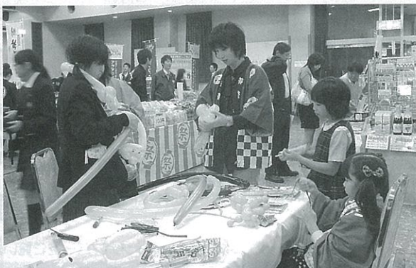
子供に大人気 バルーンアート体験