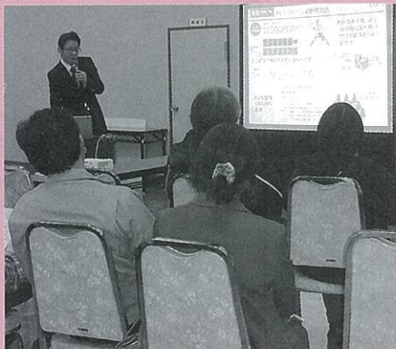
2012年 大好評だったセミナーの様子