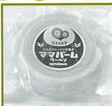
ガトーピレネ (小) 直径約9cm×厚さ約1.5cm