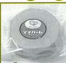
プレーン (小) 直径約8cm×厚さ約2cm