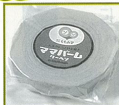
プレーン (中) 直径約14cm×厚さ約2.5cm