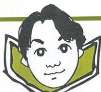
ジーエスエス 曾我