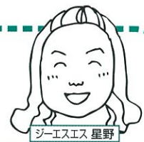
ジーエスエス 星野

スポーツや日常生活での第三者賠償やおケガ、用品損害などに備える保険です。団体割引も適用でお安くなっています。