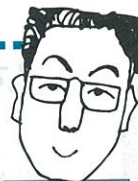
ジーエスエス 浅沼

スポーツ・レジャー保険の「自転車総合保険」についての情報だよ! 今月募集(8/1~8/31)しているから、ぜひ加入を検討してね!