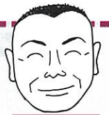
ジーエスエス 真下