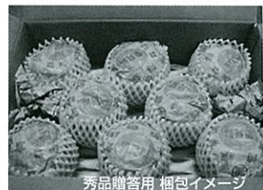
秀品贈答用 梱包イメージ

秀品(個包装) ● 贈答用 秀品 ● 自宅用 大きさ・形など粒ぞろいの一級品をそろえています。(贈答品は一つ一つ個別包装です)