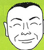
ジーエスエス 真下