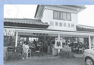
生産者：カネカ果樹園 高崎市下里見町 589