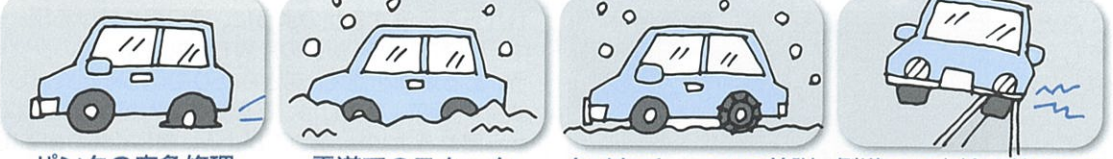
パンクの応急修理 雪道でのスタック タイヤチェーンの着脱 側溝への車輪の落ち込み