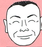
ジーエスエス 真下