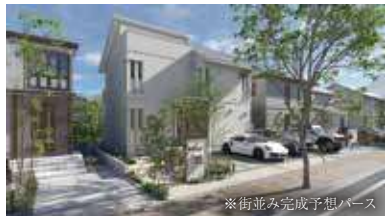
※街並み完成予想パース

安心のセキスイハイム施工で、 家族の理想をかたちにする住まいづくりが 始まります。