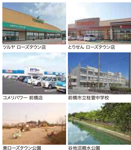
ツルヤ ローズタウン店