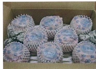
秀品贈答用 梱包イメージ