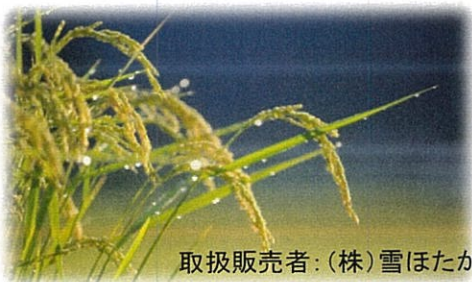
取扱販売者：(株)雪ほたか